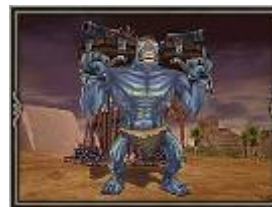
召喚獣ジャイアント