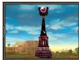
建築物(オベリスク)