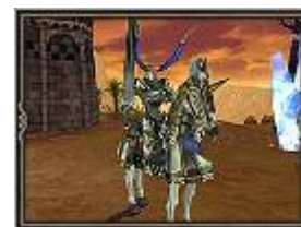
召喚獣ナイト (召喚獣相手のみ強い)